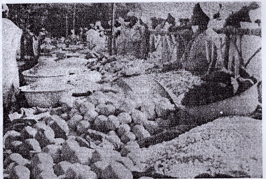
Les femmes du P.D.G. sont partout présentes, en bonnes militantes. Sur le front de la production comme au foyer ou sur celui de l'éducation. Ici, on les reconnaît à la foire exposition de Dalaba devant un étalage de produits divers symbole de leur participation effective dans notre bataille économique.

M. Gabriel D'Arboussier a rejoint par hélicoptère le Chef de l'Etat à l'intérieur du pays.